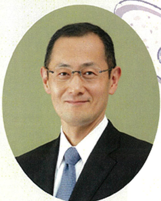
京都大学iPS細胞研究所 山中伸弥 所長・教授