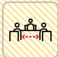
身体的距離の確保