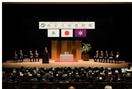
「みどりの感謝祭式典」