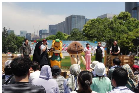
「みどりとふれあうフェスティバル」