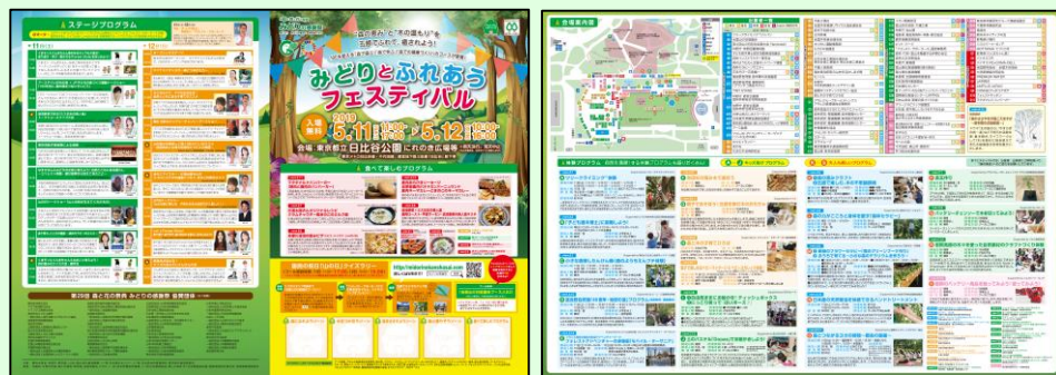
(2019年度 当日配布パンフレット)