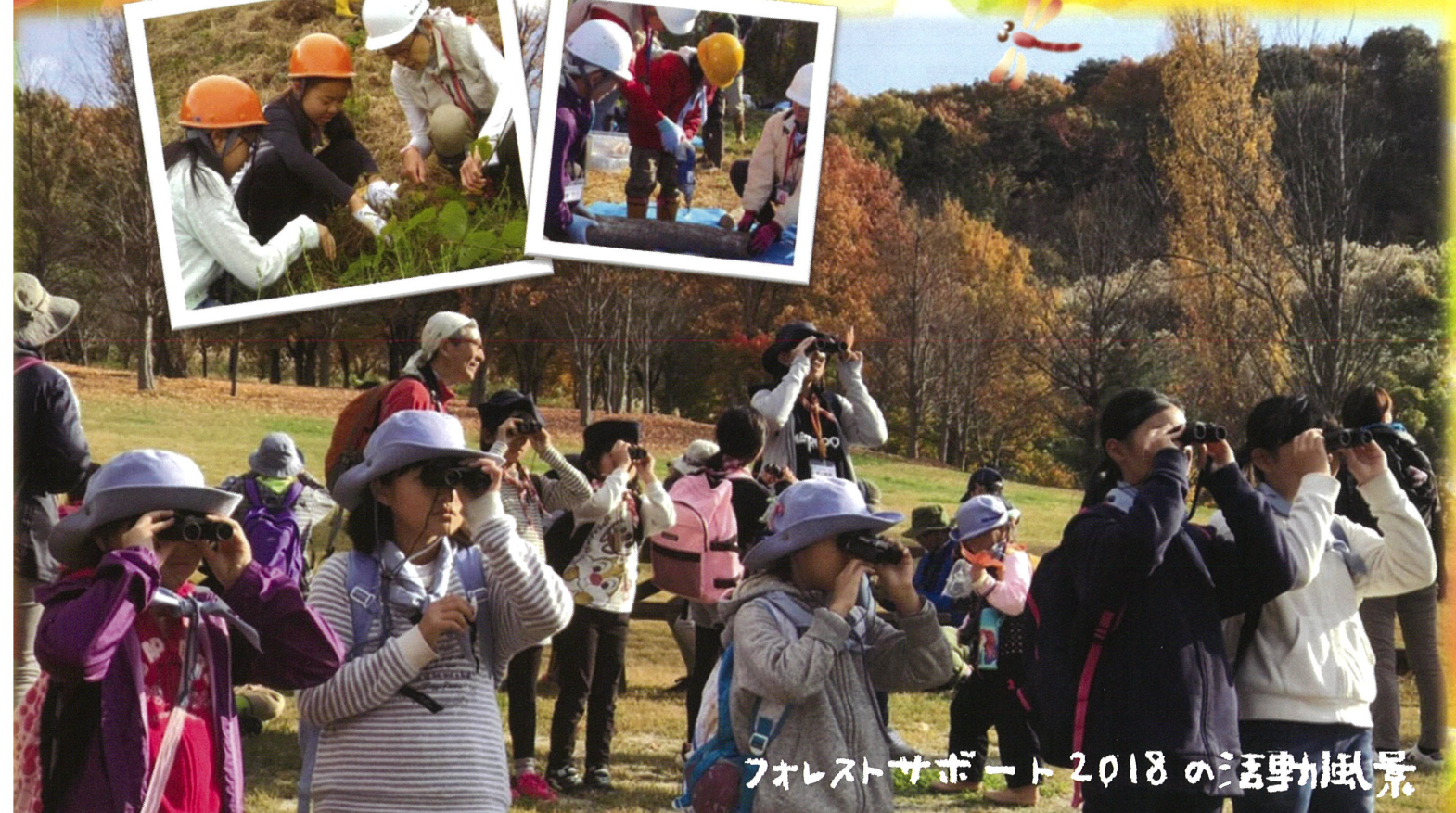
フォレストサポート2018の活動風景