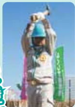
■新割り・丸太切り