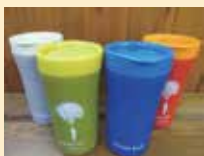
オリジナルタンブラー