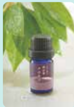
■森林のアロマづくり