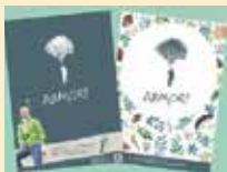
オリジナルクリアファイル