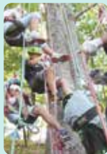
■ツリークライミング