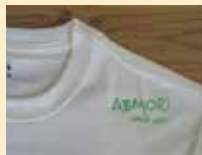
オリジナルTシャツ