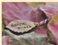
オリジナルキーホルダー