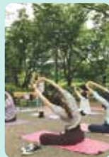
■森林セラビィヨガ