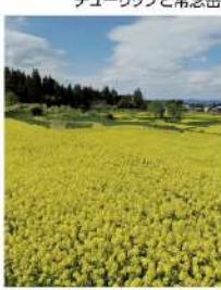
棚田に広がるナノハナ畑

4月は38万本もの色とりどりのチューリップが咲き、5月には約6haの花畑を500万本のナノハナが埋め尽くし、6月はユリの花へ。北アルプスを背景に繰り広げられる庄巻の「花の開花リレー」をお楽しみください。