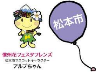
信州花フェスタフレンズ 松本市マスコットキャラクター アルプちゃん

開催期間 ● 5月25日(土) - 6月8日(土) 【会場】 松本駅前広場、中央西公園などの 公共施設、商業施設 など