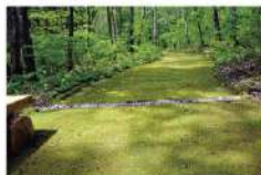
車イスが通行できるやさしい園路(苔の道)

公園内では、ネコヤナギやカタクリ、ヤマアジサイなど季節ごとに多くの自生植物がみられます。水生生物が生息するピオトープや歩ける苔の道など、ありのままの自然を体感してください。