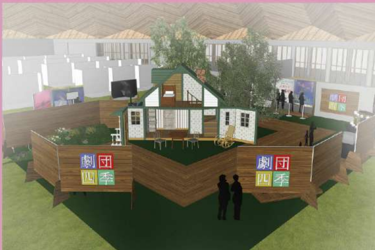
「赤毛のアン」の舞台装置(ブース中央)