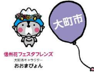
信州花フェスタフレンズ 大田市キャラクター おおまびよん

問い合わせ | 松本市サテライト会場実行委員会 電話 0263-34-3254(事務局:松本市公園緑地課)