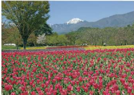
チューリップと常念岳

4月は38万本もの色とりどりのチューリップが咲き、5月には約6haの花畑を500万本のナノハナが埋め尽くし、6月はユリの花へ。北アルプスを背景に繰り広げられる庄巻の「花の開花リレー」をお楽しみください。