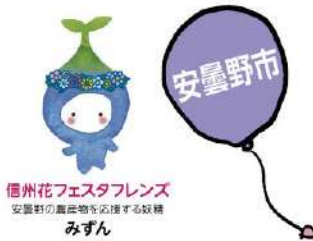
信州花フェスタフレンズ 安曇野の農産物を応援する妖精 みずん

問い合わせ | 塩尻市サテライト会場実行委員会 電話 0263-52-0280(事務局:塩尻市都市計画課)