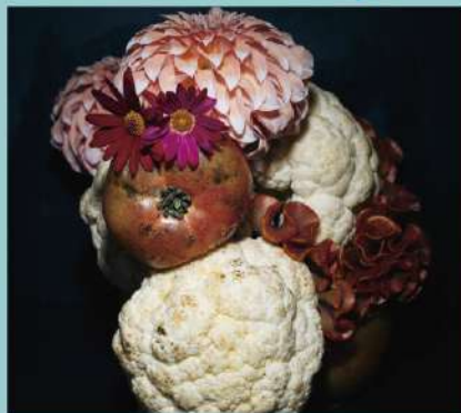
〈Monocular chimpanzee〉©JUNICHI KAKIZAKI HANA OFFICE +PEALab.