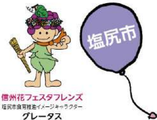
信州花フェスタフレンズ 塩尻市真青熊イメージキャラクター グレータス

問い合わせ | 信濃大町サテライト会場実行委員会 電話 0261-22-0420(事務局:大町市建設課)