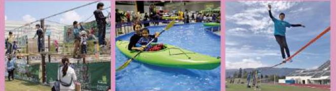
フォレストアドベンチャー

スラックラインやボルダリング、カヤック、フォレストアドベンチャーなど、人気のアクティビティがやまびこドームに大集結!インストラクターがサポートしてくれるので、初心者の方も気軽に挑戦できます。