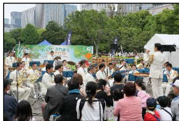
「みどりとふれあうフェスティバル」