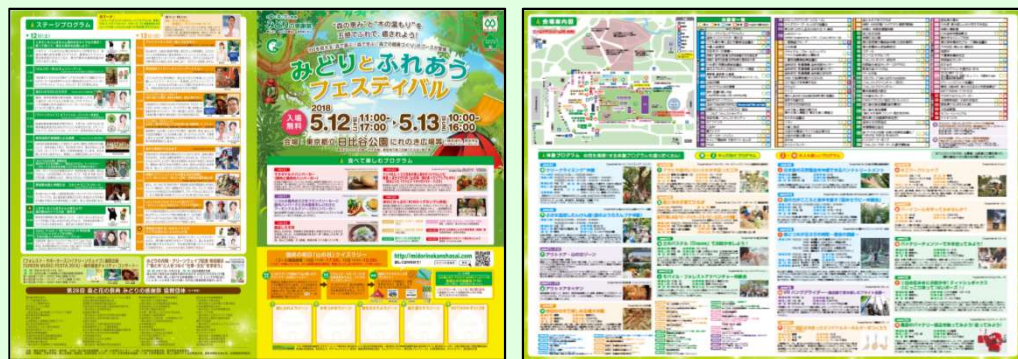
(2018年度 当日配布パンフレット)