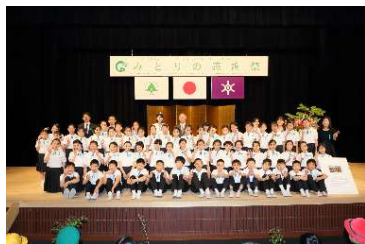
「みどりの感謝祭式典」