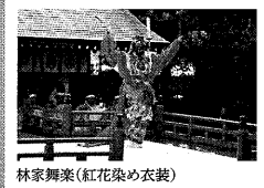
林家舞楽(紅花染め衣装)