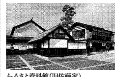
ふるさと資料館(旧佐藤家)