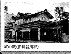
紅の蔵(旧長谷川家)