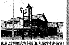
芭蕉、清風歴史資料館(旧丸屋鈴木家住宅)