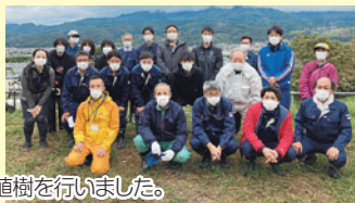
2年ぶりに社員で植樹を行いました。