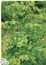
令和3年春 桜とヤマボウシの花が咲きました。