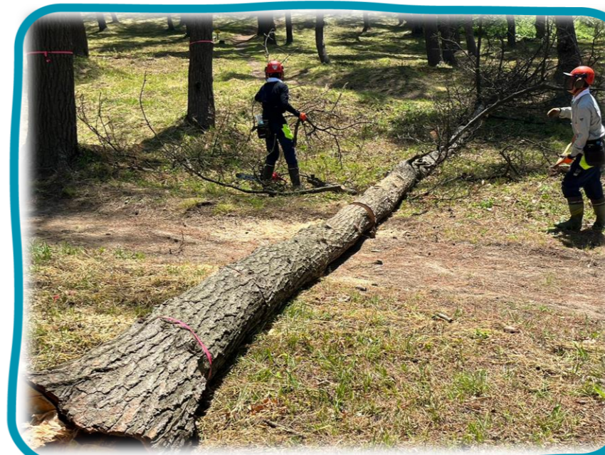
地域住民と社員等による間伐や森林組合への受託による被害木の伐倒