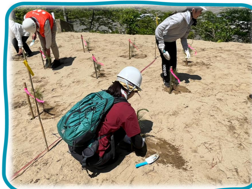
地元の方々と協働でクロマツの植栽を実施