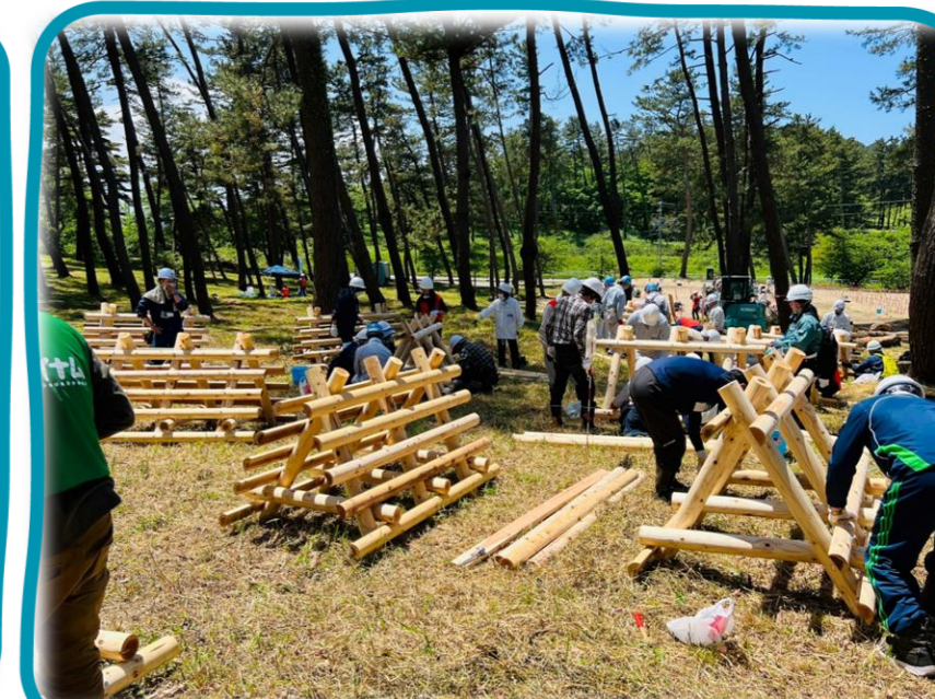
植栽した苗木を強風から守るための、防風柵の作成