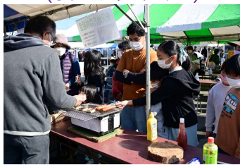
フランクフルトの炭焼き体験