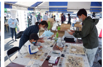
地球のカケラ ワークショップ (Dopasアート)