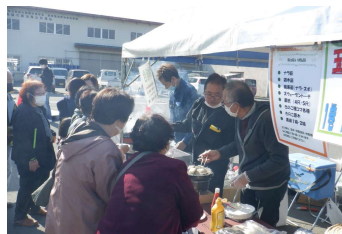
お餅の炭焼き体験