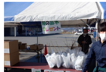
ヤマザクラの苗木プレゼント ※南陽市市の木