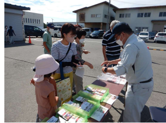
花の種プレゼント