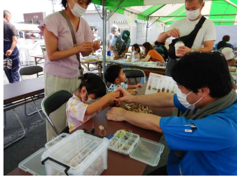
木育ワークショップ (もくロックキーホルダー)

→自然環境学習をとおして森林からの恩恵を学び、今後の森林保護や森林資源活用への興味関心を高めていただく目的。