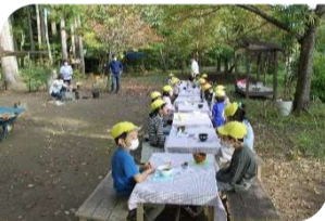
森の中できのこパーティー