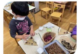
森の材料で何作ろう？