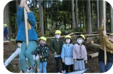
スイスイ上手に登れるよ♪