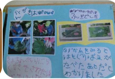
葉っぱのごちそう