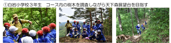
①白岩小学校3年生 コース内の樹木を調査しながら天下森展望台を目指す 菜の実をみんなで食べる 天下森展望台 ロープ橋を登り降り

①6月14日 天下森トレッキング 白岩小1年生15名 ②8月27日 ガールスカウト山形県第9団 12名