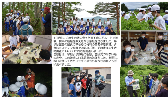
1日目は、3年生の跡に登った天下森に逆ルートで挑戦。樹木の維持を教えながら急坂を登りました。帰りは翌日の昼食の準備の材料のヨモギを収穫。夕食はメスティン炊飯でお好みご飯。その後夜の生き物講座でTASSHO周辺を調査しました。 2日目は、早朝より野鳥の観察。音が出ない鳥の声や、この時期にいる野鳥の雛を捕まえました。お昼は、昨日収穫してきたヨモギで雑もちまを作りお楽しみ会を行いました。