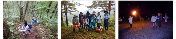
②ガールスカウト山形県第9団 天下森トレッキングやキャンプファイヤーを体験 ロープ橋登り 天下森展望台 キャンプファイヤー